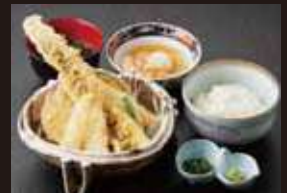
穴子 一本揚げ定食 970円