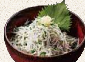
釜揚げしらす丼 880円