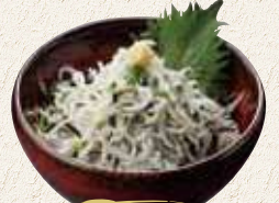
ミニ釜揚げしらす丼 500円