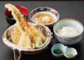
海鮮 天ぷら定食 1,070円