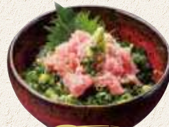
ミニネギトロ丼 500円