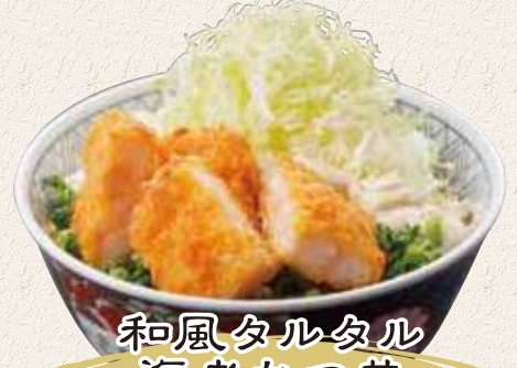
和風タルタル 海老かつ丼 750円