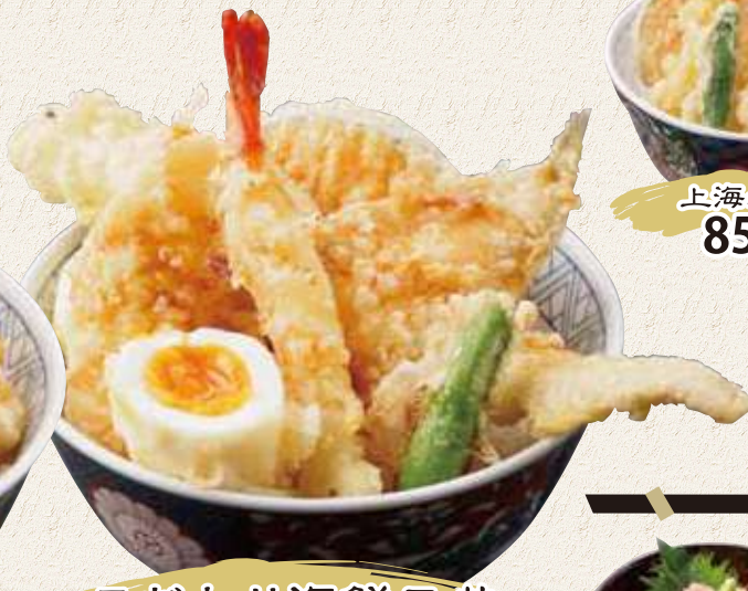
こだわり海鮮天丼