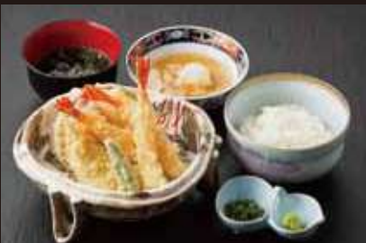
糸上天ぷら定食 970円